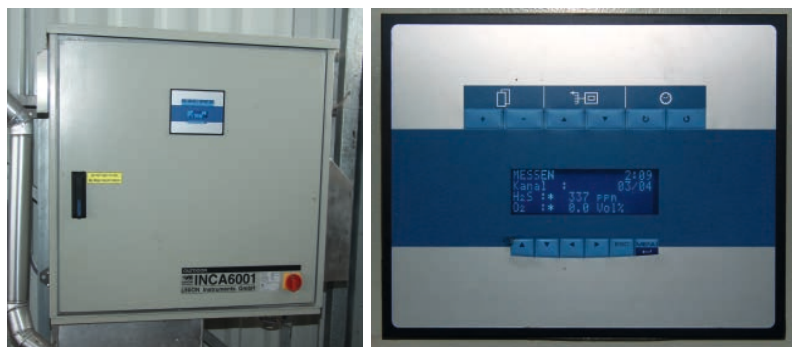
Abbildung 4 INCA Gasanalysator in Wandmontage und Anzeigefeld

onen, was häufig zu Falschmessungen oder Ausfall der Messung führt.