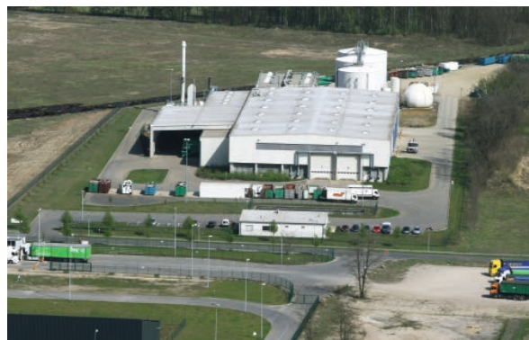
Abbildung 1 MBA Schwarze Elster in Freienhufen (Brandenburg)

In der Nassaufbereitung wird der Teilstrom kleiner 35 mm in Pulpfern (Stofflösern) in Wasser aufgelöst, so